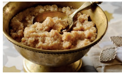
Le Gommage aux Céréales Berbères, au Miel & à la Gelée Royale Corps Berber Cereal Scrub, with Honey & Royal Jelly Body

Ever since its creation and thanks to the strong impetus of its founder, Charme d'Orient has nurtured a passion and a genuine expertise in passing down authentic cosmetic formulas without compromising over the quality and nobility of its raw materials.