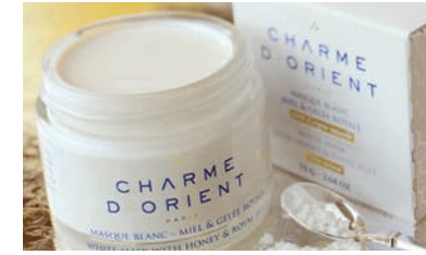
Le Masque Blanc au Miel & à la Gelée Royale Corps & Visage White Mask with Honey & Royal Jelly Face & Body