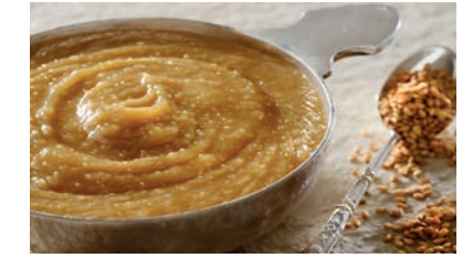
Le Masque Crème de Sésame Visage & Corps Sesame Cream Mask Face & Body