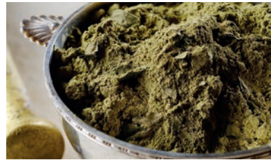
Le Bronzage au Henné Visage & Corps Henna Tanning Face & Body